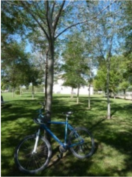
Ermita La Aparecida