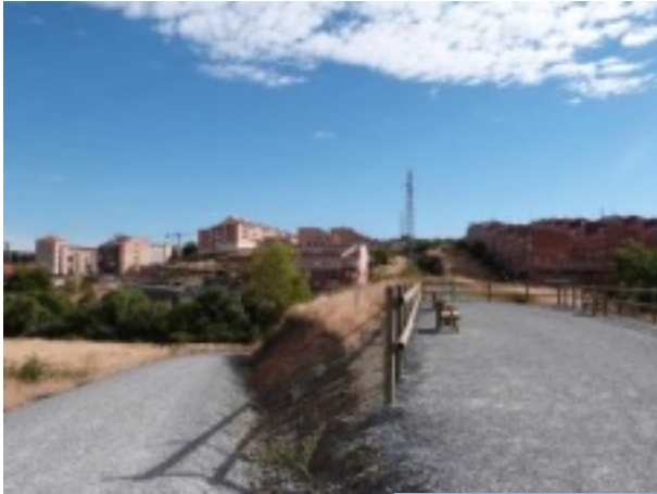
Inicio del recorrido en el