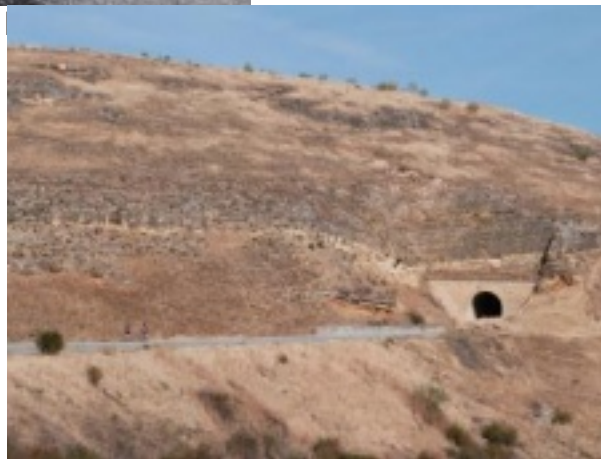
Vía Verde antes de llegar a Perogordo