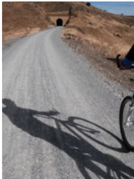
Túnel próximo al inicio de la Vía Verde