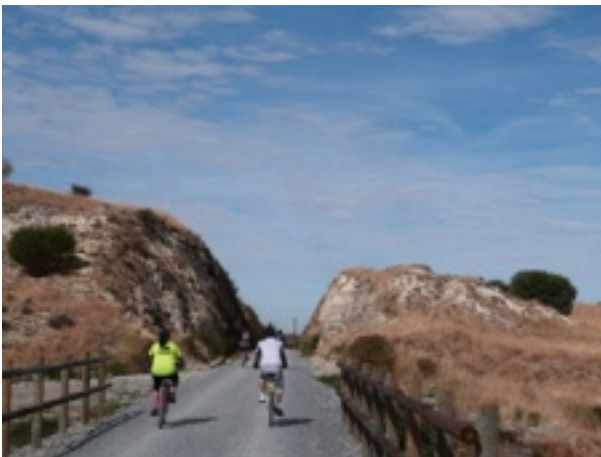
Detalle del recorrido